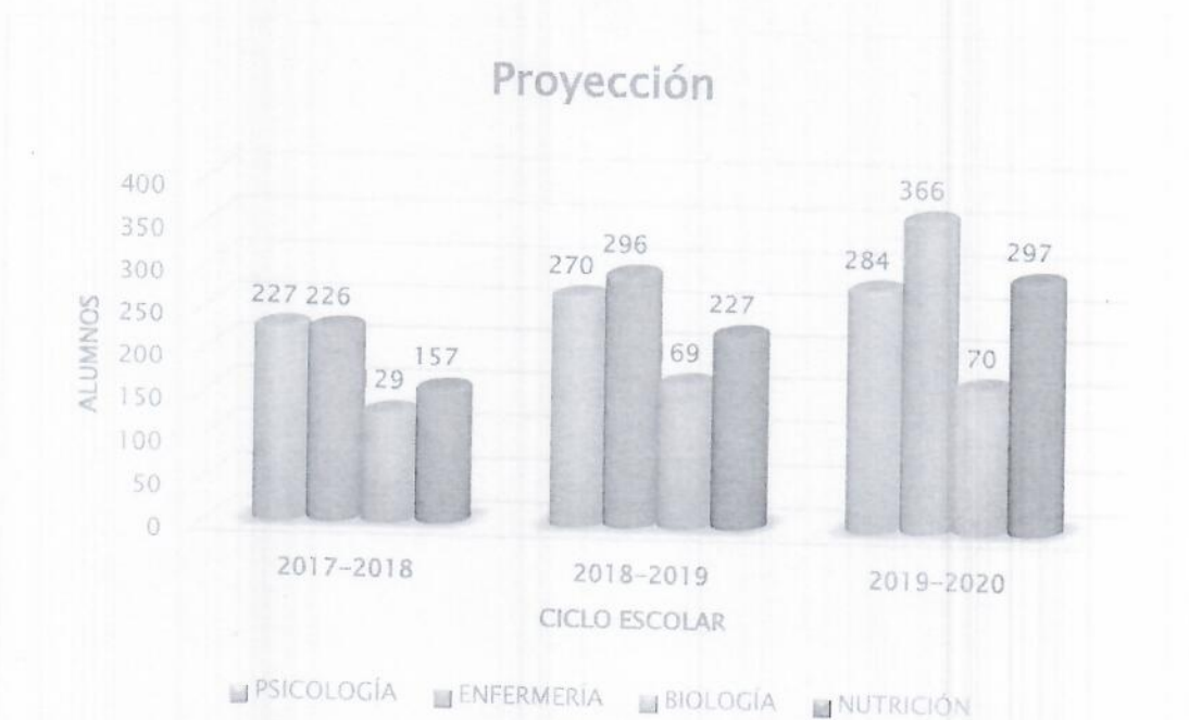
Gráfica 2. Proyección de la matrícula en los próximos tres años.

Para lo cual tendremos la siguiente proyección de matrícula: